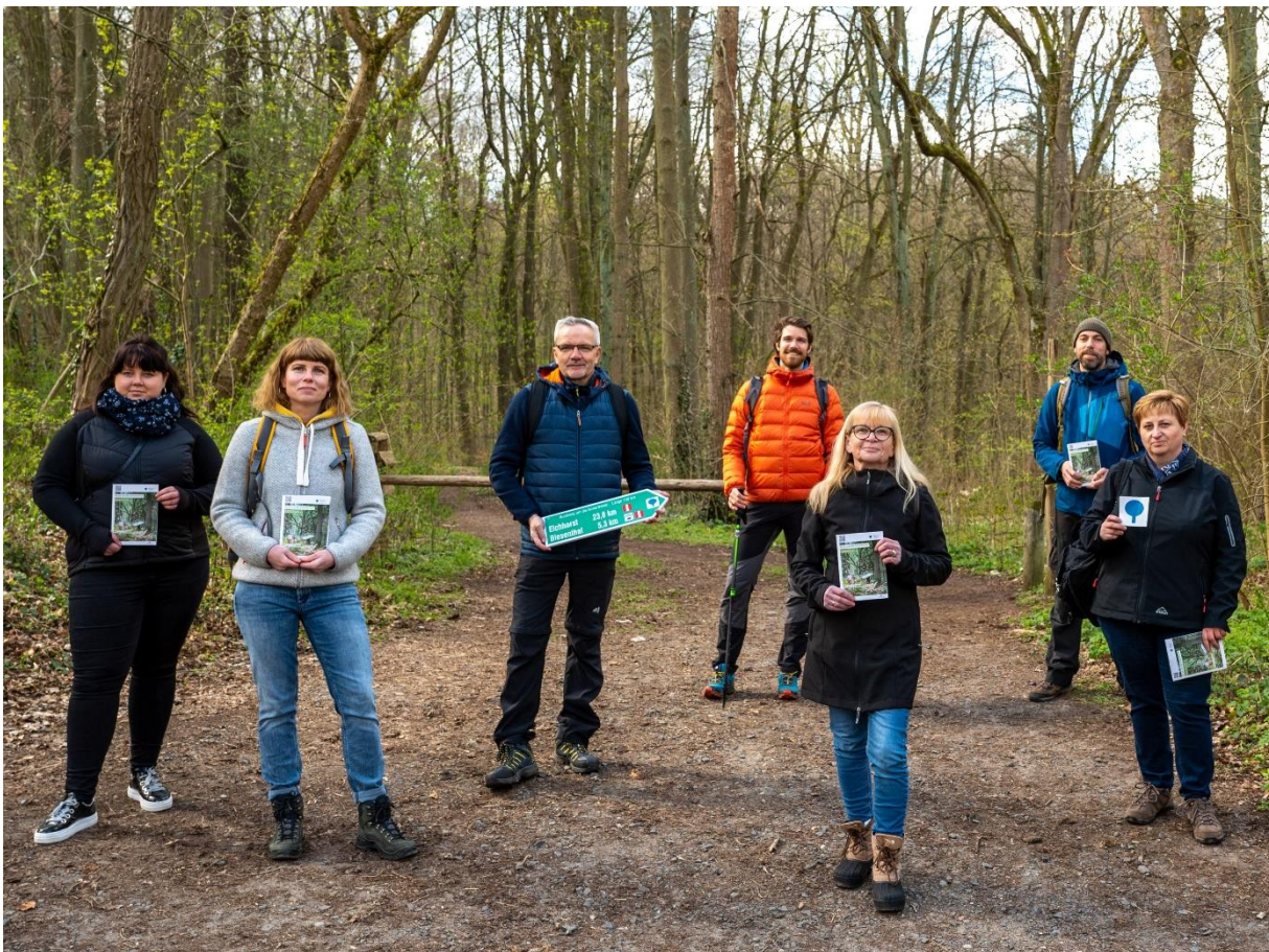
Foto 1: Freuen Sie sich auf die druckfrische Wanderbroschüre, für die neue Wanderfotos entlang des Weges gemacht wurden: Die Projektpartner des Rundwanderwegs „Rund um die Schorfheide“.

Zur Vermarktung des Weges wurden aussagekräftige Fotos mit einem regionalen Fotografen und Einheimischen erstellt. Die entstandenen Bilder kommen in der nun druckfrisch erschienenen kostenfreien Wanderbroschüre (bestellbar bei der WITO Barnim GmbH unter Barnimer Land — Ursprüngliches ganz nah und den am Wegesrand liegenden Tourist-Informationen) sowie auf dem Internetauftritt des Fernwanderweges www.RundumdieSchorfheide.de zum Einsatz. Die Broschüre lädt dazu ein, den Weg zu erwandern und gibt wertvolle Informationen und Tipps für die Planung des Wanderurlaubs und die einzelnen Tagesetappen.