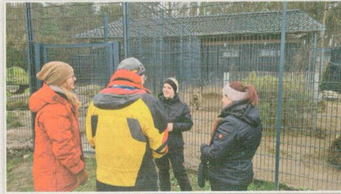
Die Tour-Guides geben sich bei den Führungen im Wildkatzenzentrum stets größte Mühe.

Das Felidae Wildkatzen- und Artenschutzzentrum Barnim entstand 1998 aus einer privaten Initiative des Tierarztes Renato